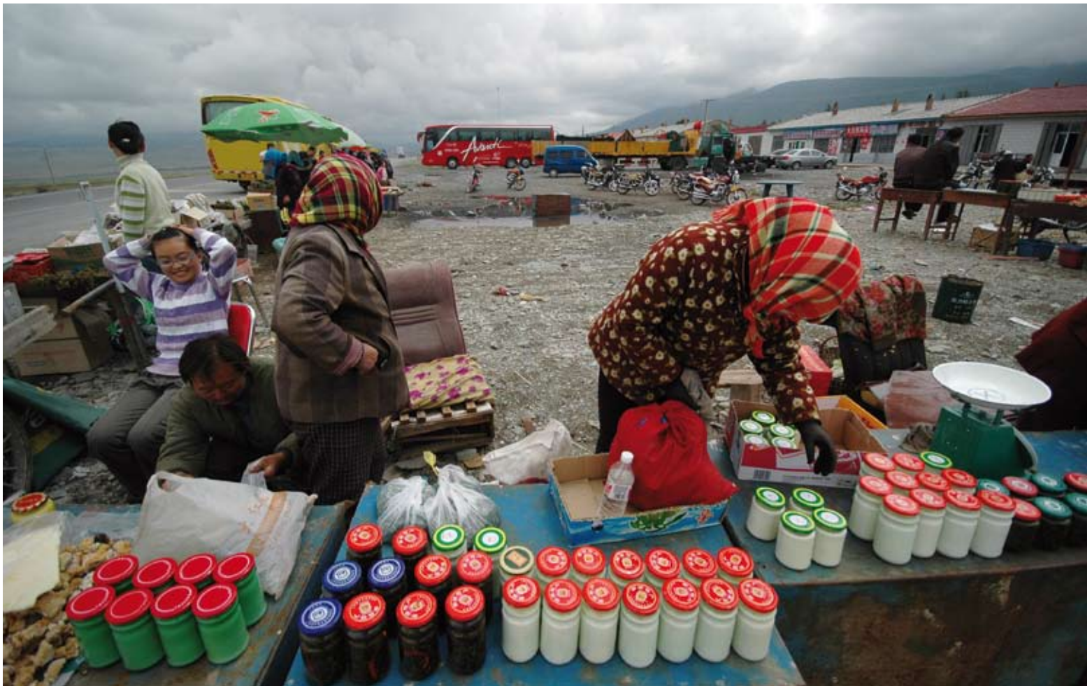
Ein Straßenmarkt an der Road 312

Teil in China sind einfach katastrophal. Das ist wie eine Fahrwerks-Teststrecke. Und das über tausende Kilometer – nur Rüttelstrecke.