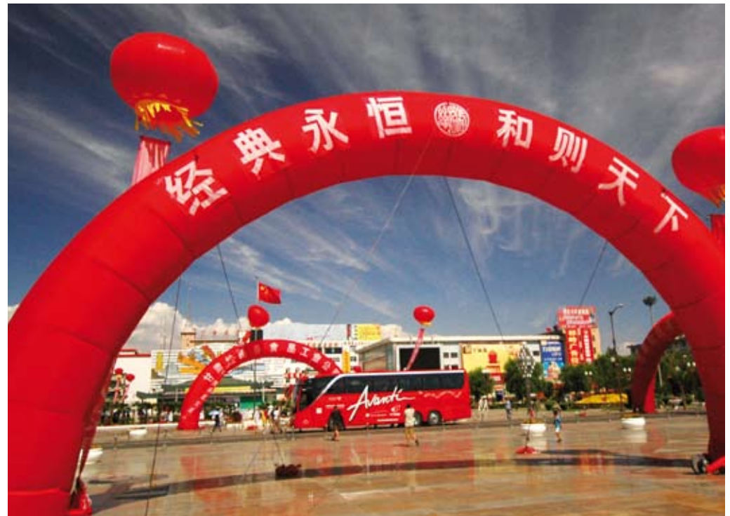
Ein Platz in Zhangye