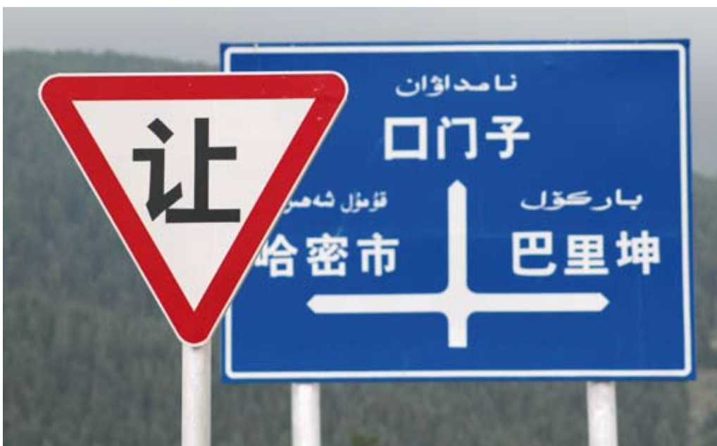
Chinesische Schilder: dank einheimischer Reiseführer kein Problem