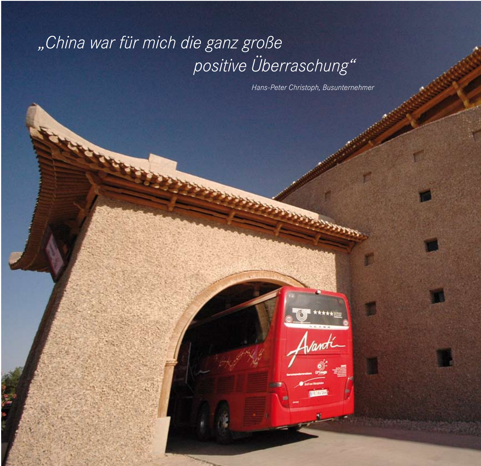
Einfahrt zum Hotel in der Oasenstadt Dunhuang