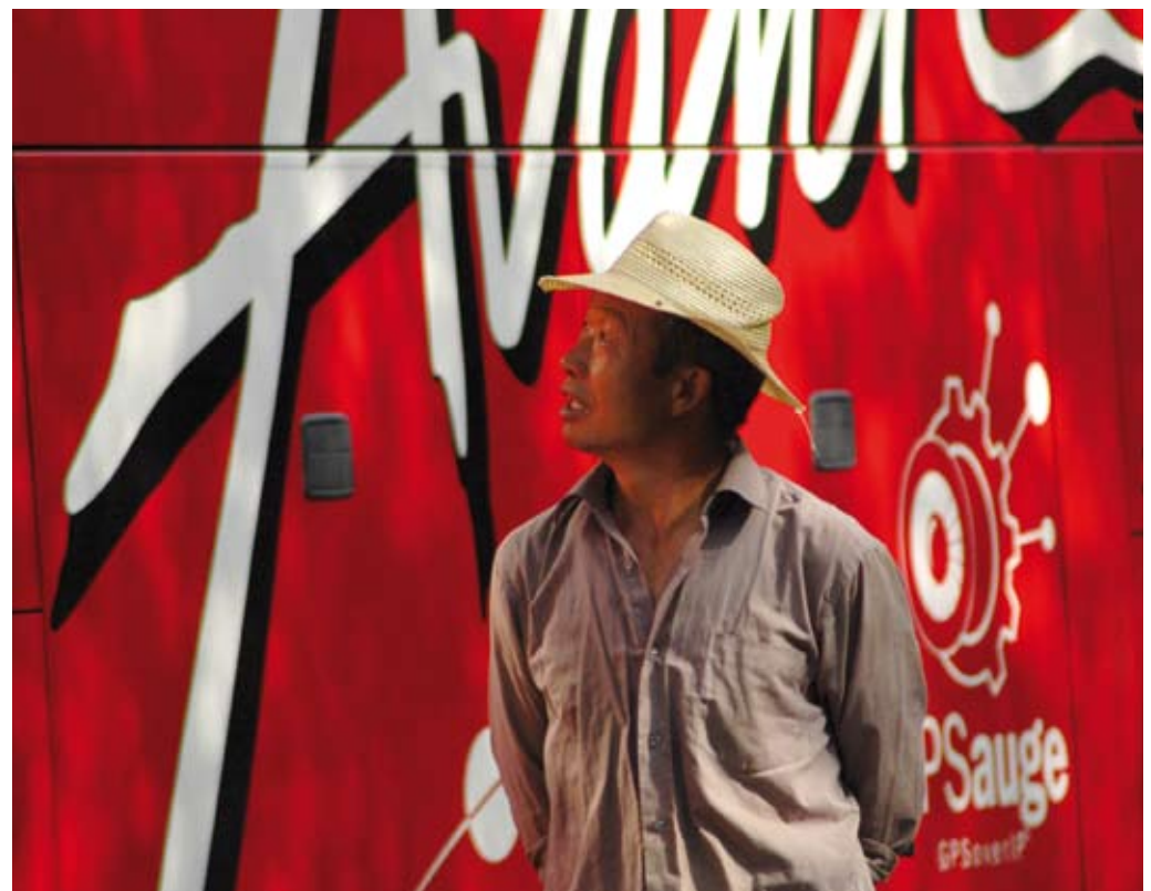
Hingucker: Der feuerwehrrrote Setra sorgt überall für Aufsehen