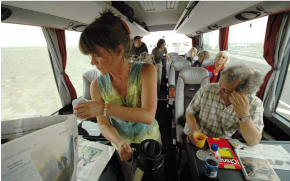
Entspannt reisen: Nur zwei Drittel der Plätze sind belegt

ich für den Abriss alter Städte plädiere, aber wie die Chinesen planen und neu bauen, das ist phänomenal. Es hat mich beeindruckt, wie entwickelt China ist, das hätte ich nie im Leben gedacht.