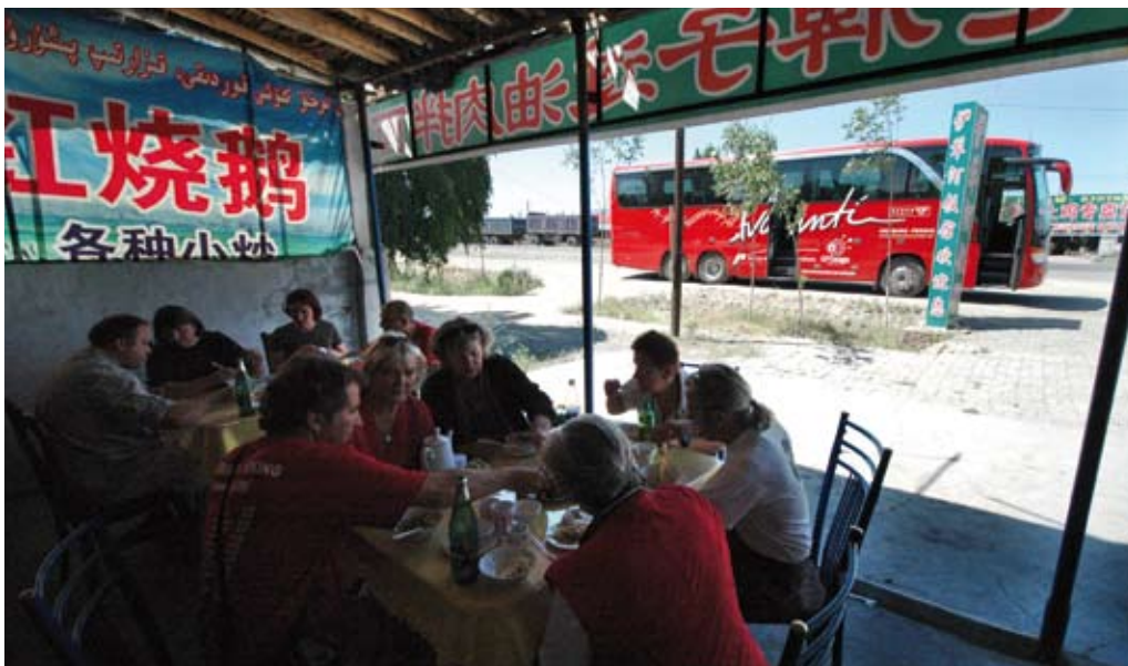
Mittagessen in einem Rasthaus an der Road 312

Auf diesen 30.000 Kilometern ist der sicher beansprucht worden wie unter normalen Umständen auf einer Million Kilometern. Die Straßenverhältnisse in Zentralasien und zum