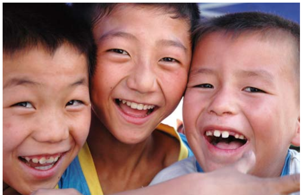
Große Freude über den Besuch aus dem fernen Deutschland